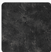
3953 PE Břidlice černá Povrchová struktura Perlička